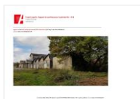
Avr. 2022 | ADU Contact : C. KUHN

Le projet Ecopolis lancé par l'Agence Nationale de la Recherche (ANR), regroupe des acteurs publics et privés, co-financé par le FEDER, la Région Bourgogne Franche-Comté et Pays de Montbéliard Agglomération, dans le cadre du plan d'investissement France 2030. Un site pilote de 2 ha situé sur la friche industrielle rue des Gravieres à Vieux-Charmont prévoit la mise en œuvre d'un Living Lab pour étudier les capacités des plantes à gérer la pollution des sols (phytomanagement) et sensibiliser un public large à l'intérêt des phytotechnologies.