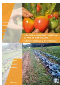
Mars 2022 | ADU Contact : E. SCHMITT

L'Agglomération du Pays de Montbéliard est engagée dans une politique de soutien à l'agriculture locale. En 2018, elle a adopté le Projet Alimentaire Territorial (PAT) pour soutenir et diversifier l'agriculture sur son territoire et répondre aux nombreuses initiatives privées de développement d'exploitations de proximité.