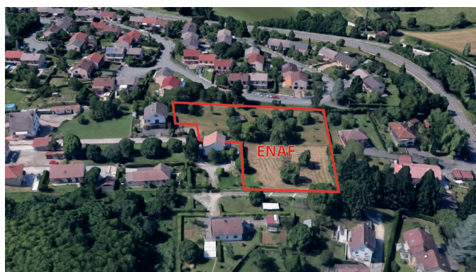
Illustration : comme ici, certaines grandes dents creuses sont à considérer comme des ENAF. Ces espaces pourraient donc bien être comptabilisés dans la garantie minimale.

A la lecture de cette disposition, cette garantie n'est pas un droit à urbaniser un hectare en extension : il s'agit bien d'un hectare de consommation d'espaces naturels, agricoles ou forestiers (ENAF), et non d'un hectare d'extension.