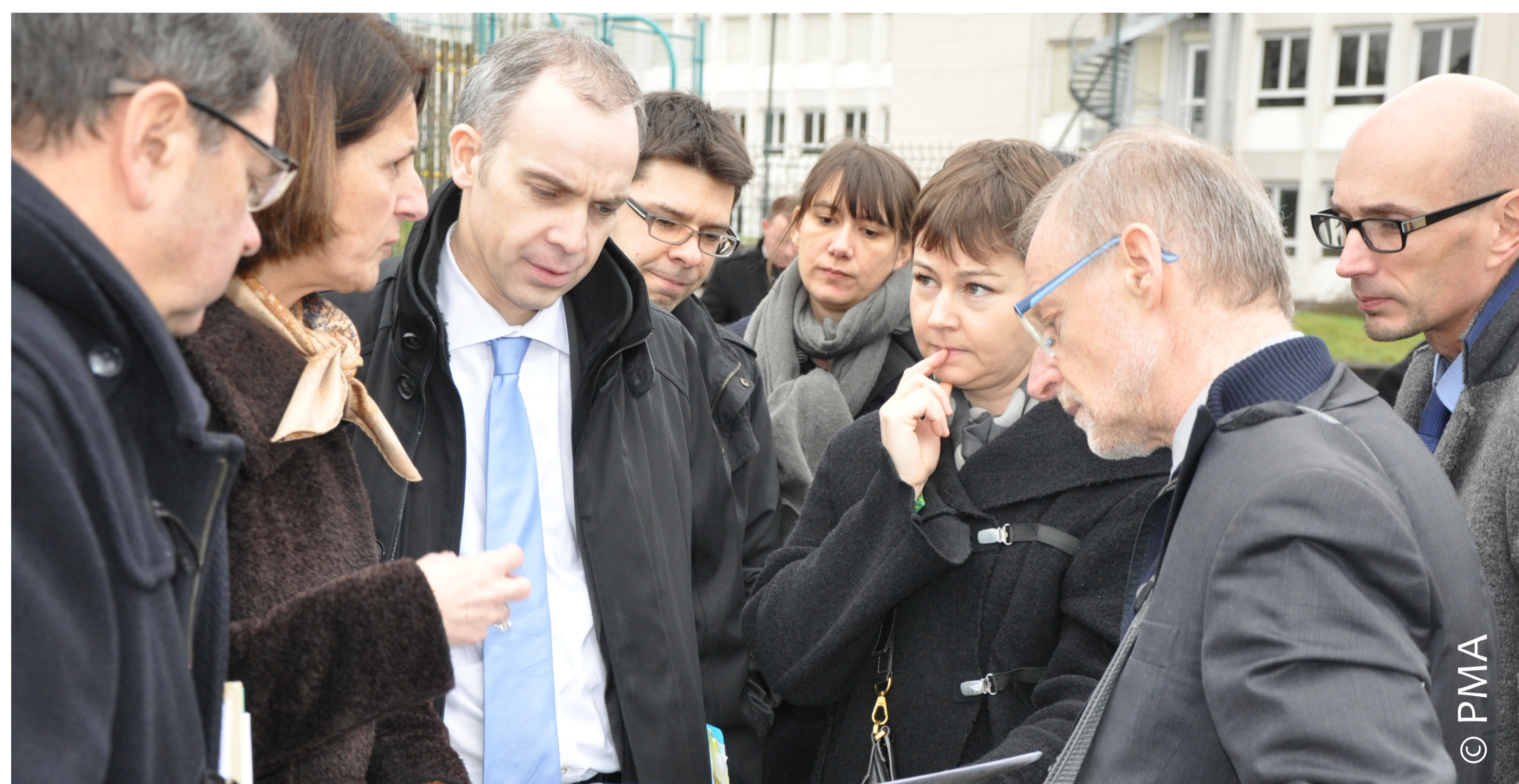
De gauche à droite les acteurs au moment du lancement : Préfet du Doubs, Maire de Montbéliard, Directeur général de l'ANRU, Directeur service renouvellement urbain PMA, chargée d'opération ANRU, architecte ADU, Délégué local de l'ANRU à la DDT et chef de service renouvellement urbain DDT

Deux quartiers de l'Agglomération du Pays de Montbéliard bénéficient du Nouveau Programme National de Renouvellement Urbain (NPNRU) : la Petite-Hollande à Montbéliard et Graviers-Evoironnes à Sochaux. Le NPNRU s'organise en deux étapes : des études préalables pendant le protocole de préfiguration et la mise en œuvre dans le cadre d'une convention pluriannuelle signée le 3 mars 2020.