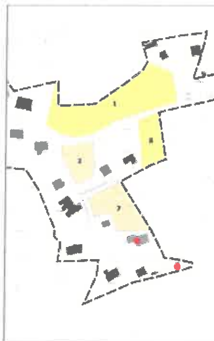
Secteur 8 : impasse Vergeoulot (1036 m 2 )