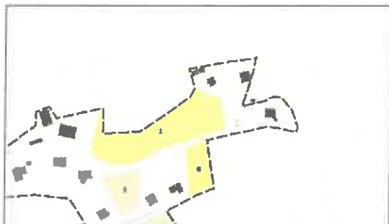
Secteur 1 : rue de la Lavé (4107 m 2 )