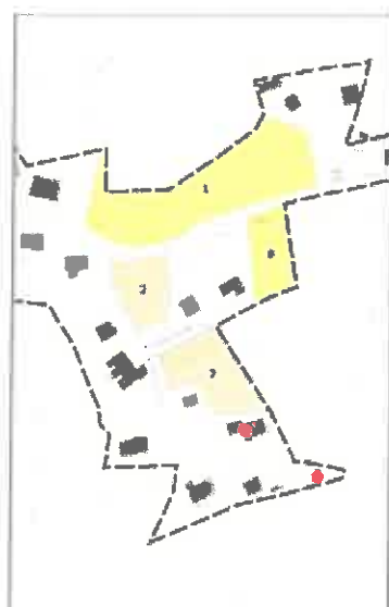
Secteur 7 : rue Vergeoulot (1505 m 2 )